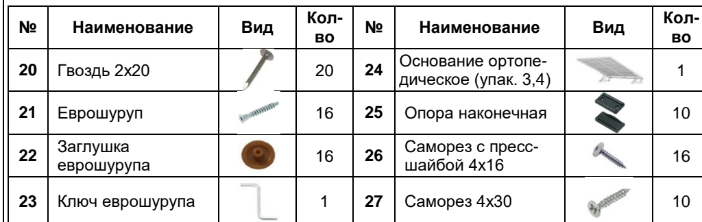
Схема сборки. Кровать Диана