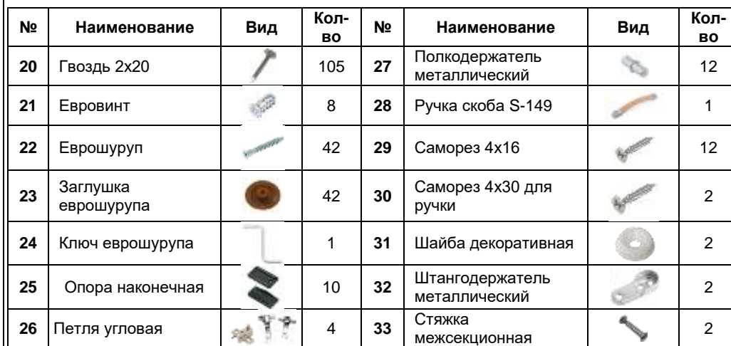
Схема сборки. Шкаф угловой Диана