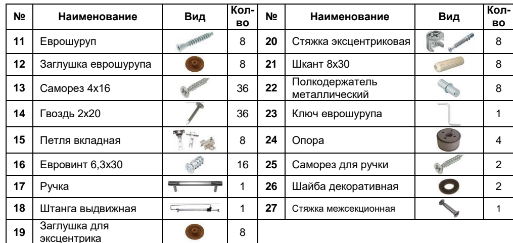
Схема сборки. Прихожая Инфинити Шкаф-пенал